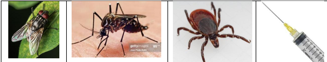
চিত্ৰ : ৰোগ সংক্ৰমণ চক্ৰ